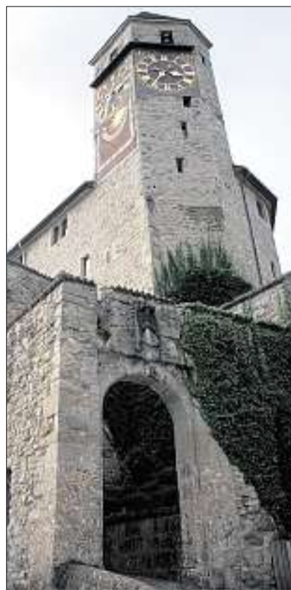
Die passende Kulisse.

Seine Durchlaucht Erbprinz Alois von und zu Liechtenstein kommt mit den Bundespräsidenten von Österreich und Deutschland zu Besuch.